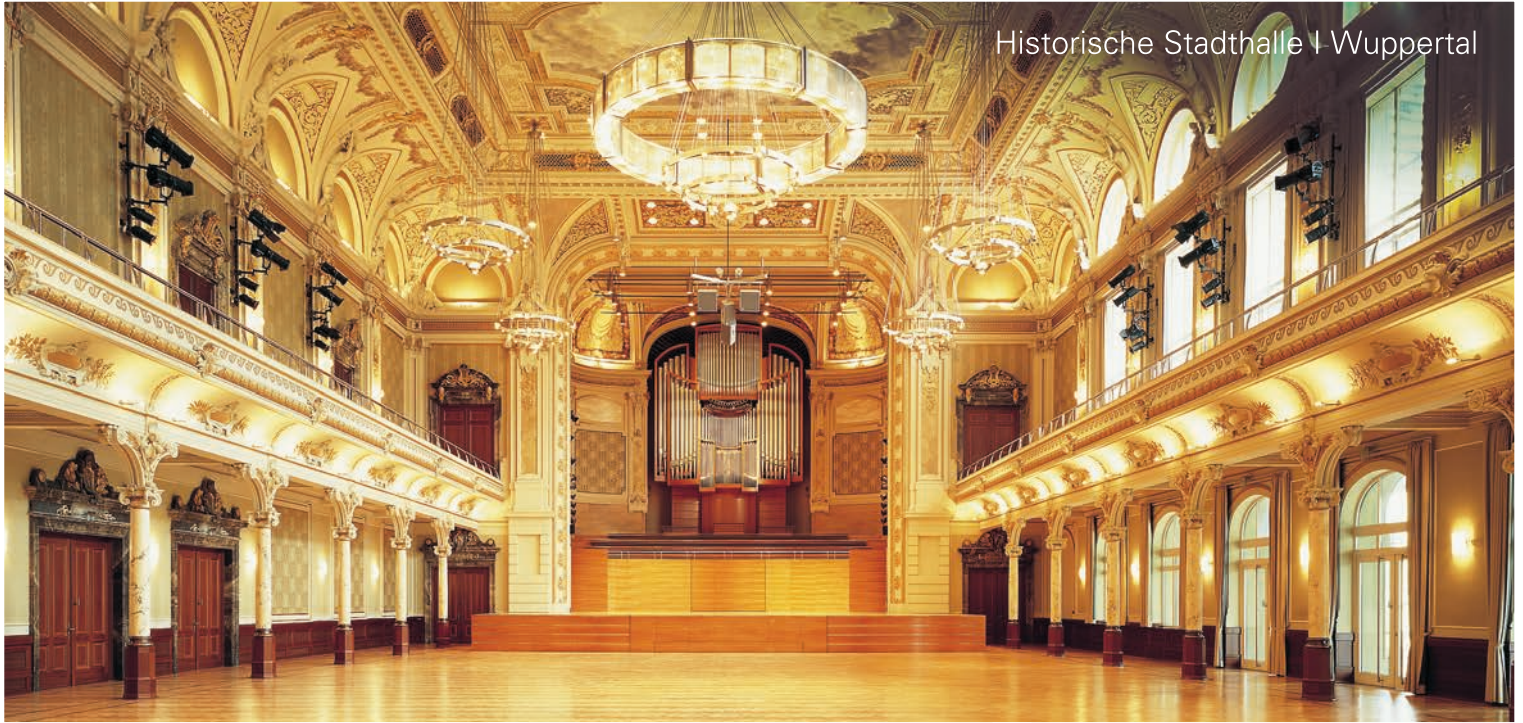
Historische Stadthalle | Wuppertal